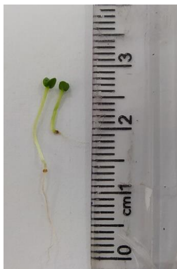
شکل ۲- تاثیر تنش شوری (۱۵۰ میلی مولار، راست) بر طول ریشه‌چه و ساقچه گیاهچه حنا در مقایسه با شاهد (صفر میلی مولار، چپ).

Different letters in each column indicate statistical differences between treatments using HSD ( P \leq 0.05 ).