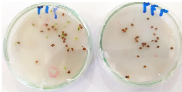
شکل ۱- اثر تنش شوری (۱۵۰ میلی مولار، راست) بر سرعت جوانه‌زنی بذور حنا در مقایسه با شاهد (صفر میلی مولار، چپ) در روز سوم آزمایش.

Figure 2- Effect of salinity stress (150 mM, right) on radicle and plumule length of Henna seedling compared to control (0 mM, left).