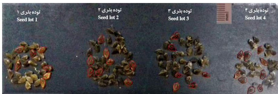
شکل ۱- اندازه گیری ویژگی های مورفومتریک بذر گیاه گندم سیاه با استفاده از نرم افزار دیجی مایزر